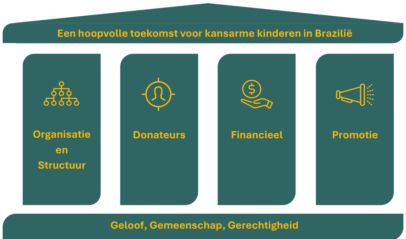
Figuur 1: De waarden, pilaren en missie van het werk van Care for Brazil

In de afgelopen jaren zijn de kosten in Brazilië aanzienlijk gestegen, terwijl de inkomsten uit Nederland juist zijn afgenomen. Ondanks deze uitdaging heeft Stichting Care for Brazil succesvol kunnen inspelen op de dalende inkomsten door de operationele kosten te verlagen. Dit heeft ons in staat gesteld om financieel stabiel te blijven. Bovendien zijn de inkomsten uit donaties de afgelopen periode gestabiliseerd en is er recent zelfs een lichte groei zichtbaar. Dankzij deze ontwikkelingen hebben we de afgelopen vijf jaar elke maand een vast bedrag kunnen overmaken naar Brazilië, waarmee we een betrouwbare partner zijn gebleven voor Stichting OSFA. Het is echter belangrijk te erkennen dat de stijgende inflatie en hogere kosten in Brazilië de impact van onze financiële steun verminderen. Hierdoor heeft het overgemaakte bedrag weliswaar dezelfde nominale waarde, maar is de reële waarde afgenomen, wat de effectiviteit van onze hulp beïnvloedt. Dit vraagt om voortdurende aandacht en mogelijk verdere stappen om onze impact op het leven van kansarme kinderen in Brazilië te behouden en te vergroten.